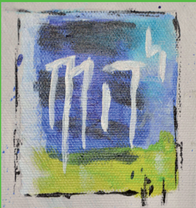
Bilder zu den 10 Geboten

Jahreslosung 2019 Suche Frieden und jage ihm nach.